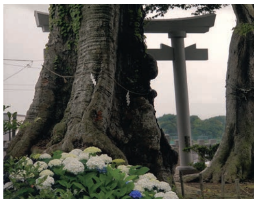
若宮八幡宮（常陸太田市）