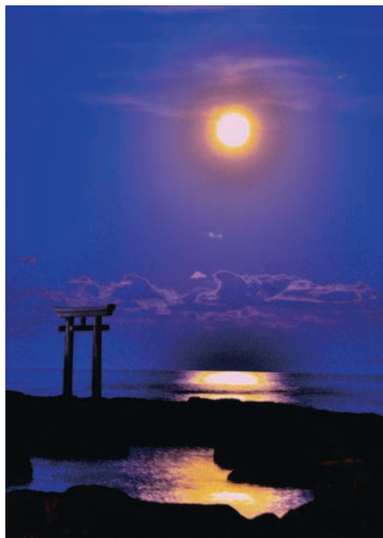
大洗磯前神社（大洗町）