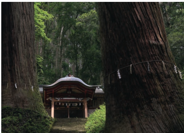
吉田八幡神社（常陸大宮市）