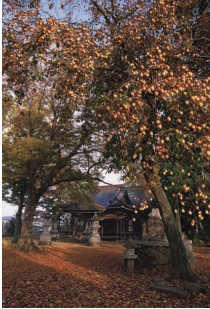
日枝神社（つくば市）