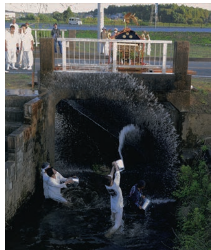
竹原神社（小美玉市）