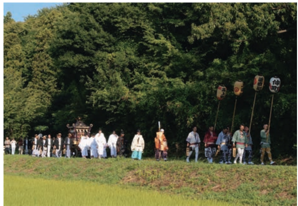
五所駒瀧神社 (桜川市)