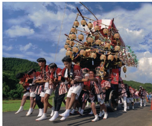
鷲子山上神社（常陸大宮市）