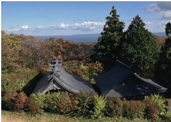
八溝嶺神社（大子町）