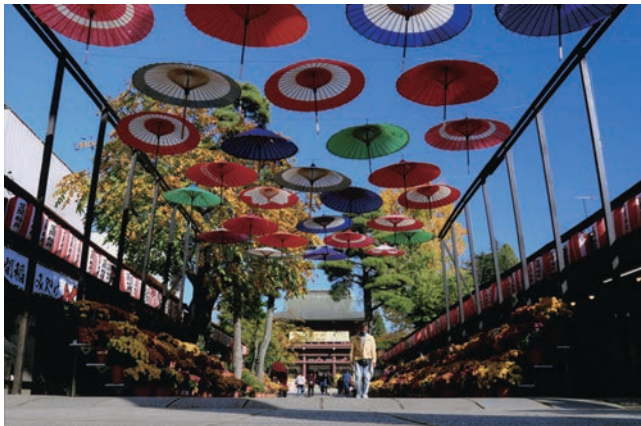
笠間稲荷神社（笠間市）