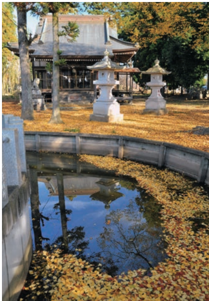
日枝神社（つくば市）