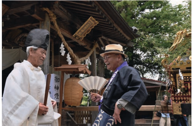
立野神社 (常陸大宮市)