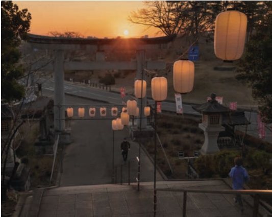
茨城県護国神社（水戸市）